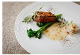
京鴨 菊芋 コーヒー