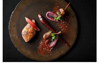
ラカン産仔鳩 紫人参 カカオ