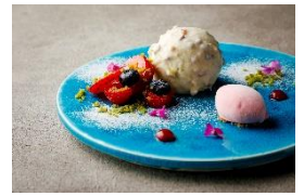
ピスタチオ ラズベリー ショコラブラン