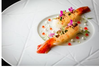
牡丹海老 レモングラス フロマーージュブラン

「自然・芸術・料理」をモチーフに、型にはまらない美しさを追求したフレンチをご提供するレストラン「TENJIN」では、「シェフズテーブル」「オールデイダイニング」「ザ バー」と3つに分かれたシーンそれぞれで、冬に旬を迎える素材のおいしさを存分に引き出したメニューをご用意いたします。深い自然に抱かれた洛北・鷹峯の山麓で、この時季だけのダイニングエクスペリエンスをお楽しみください。