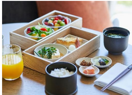
インルームダイニング朝食