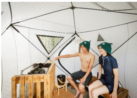
プールサイドサウナ

寒い冬に縮こまった身体を芯から温め、滞った身体のめぐりを整える冬季限定のウェルネスパッケージとして、雄大な自然の中でのサウナ体験とスパトリートメントを組み合わせた「THE ROKU SPA サウナ&トリートメントプラン」を販売いたします。北山杉や京都ヒノキ、レモングラスをブレンドしたホテルオリジナルアロマオイルによるセルフアロマなど、ROKU KYOTO ならではのサウナ体験を90分間たっぷりと満喫いただいた後、熟練のセラピストによるボディまたはフェイシャルトリートメントを60分間ご体験いただけます。サウナのご利用とスパトリートメントとを組み合わせることで、より高いリラックス効果が期待でき、手足の冷えを解消しつつ日常の疲れを全身から解き放っていただけます。京都の奥座敷でととのうサウナ体験と、癒しと寛ぎの空間で行うスパトリートメント、2つの人気メニューを同時に体験できる至福のウェルネスエクスペリエンスをお楽しみください。