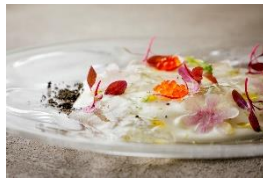
帆立 根セロリ こぶみかん