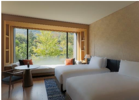
デラックスルーム

ホテルの魅力を余すことなく満喫する本プランでは、レストラン「TENJIN」でのご朝食やご夕食、「THE ROKU SPA」でのスパトリートメント、自然の中でのウェルネスアクティビティ、唐紙摺り体験やパステルスケッチ体験といったホテルオリジナルのワークショップが含まれ、ホテルに到着してからは予算を気にすることなく、ROKU KYOTO の魅力をもれなく体験していただけます。鷹峯三山の麓の美しい自然に包まれたリゾートエリアで、都会の喧騒から離れ、非日常を味わう上質な時間をご体験ください。