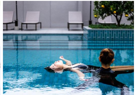
フローティングメディテーション